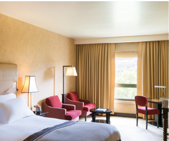
The Luxury Room

Por detrás da sua fachada contemporânea, o interior do edifício, decorado por Marc Hertrich e Nicolas Adnet, convida a uma viagem pelos descobrimentos portugueses, a essência deste elegante hotel cosmopolita. O design clássico contemporâneo dos seus 163 quartos incluindo 12 suites é sofisticado e acolhedor. Todos os quartos oferecem o conceito MyBed™, têm vista para a cidade e da suite Opera podemos admirar o Castelo de São Jorge.