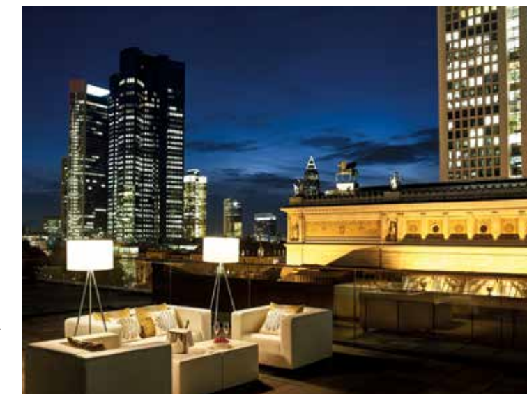
Presidential Suite - Roof Top Terrace

Le Marais, auf der "Mezzanine", ist das Schmuckstück unserer Tagungs- und Banketträumlichkeiten. Der außergewöhnliche Ballsaal überzeugt durch seine großzügigen 320 Quadratmeter und ist der perfekte Ort für außergewöhnliche Events. Hier können bis zu 270 Gäste in herrschaftlichem Ambiente durch die Nacht tanzen und träumen. Mit seinen Glasdächern, die den Saal mit Licht fluten, ist Le Marais ein exklusiver Veranstaltungsort für Seminare, Konferenzen, Zeremonien oder Produkteinführungen.