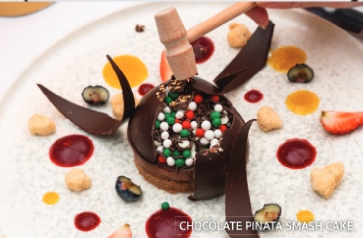
CHOCOLATE PINATA SMASH CAKE