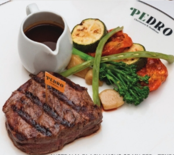
AUSTRALIA BLACK ANGUS GRAIN FED - TENDERLOIN