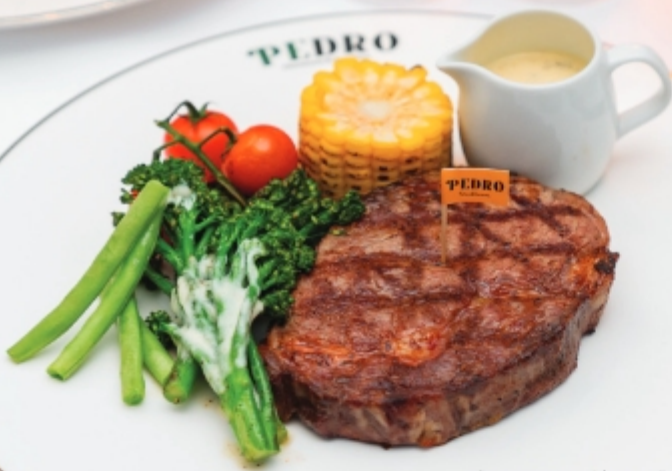
RIBEYE DRY AGED WITH CREAM TRUFFLE SAUCE AND BABY BROCCOLI