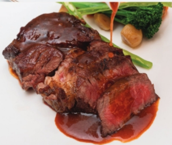
AUSTRALIA BLACK ANGUS DRY AGED 4-6 WEEK - RIBEYE