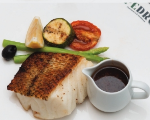
FRENCH SNOW FISH